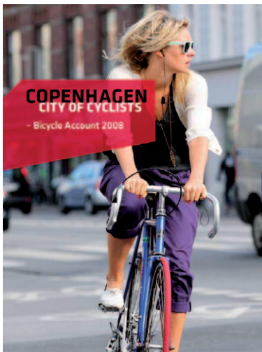
Das Cover des Kopenhagener Fahrrad-berichts 2008.

Der Fahrradbericht ist ein erster Schritt, die Kopenhagener Bevölkerung in die Planungsprozesse mit einzu-beziehen und die verkehrsbezogenen Maßnahmen der dänischen Hauptstadt gezielt in Bezug auf ihre Fahr-radfreundlichkeit öffentlich zu dokumentieren. Dies ge-schieht durch die Veröffentlichung von Broschüren, die in dänischer und englischer Sprache gedruckt und on-line erhältlich sind. Darüber hinaus werden die Ergeb-nisse des Fahrradberichts von der Stadtverwaltung als Grundlage für zukünftige Planungen genutzt. Bereits durchgeführte Maßnahmen, wie z.B. bauliche Verände-rungen im Straßenraum, werden evaluiert, um Informa-tionen darüber zu erhalten, wie das Angebot weiter zu-gunsten der Radfahrer verbessert werden könnte. Au-ßerdem sind die ermittelten Zahlen und Fakten dabei hilfreich, den Radverkehr in der öffentlichen Wahrneh-mung und in den politischen Debatten zu plat-zieren. So werden die Daten z.B. für In-terviews oder für Lob-barbeit herangezo-gen.