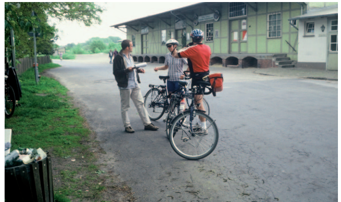
Befragung an einer touristischen Route.

Ersatzweise können Beobachtungen zum Verkehrsverhalten (Verhaltensbeobachtungen, Verkehrskonfliktbeobachtungen) Hinweise geben, ob sich das sicherheits-