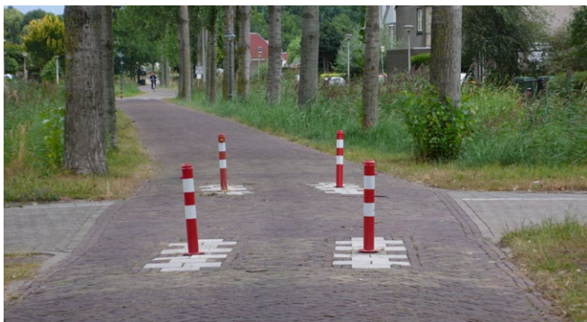
Kontrastreich gestaltete Poller (Amsterdam)

Meldung überflüssiger Pfosten eingerichtet (z.B. www.zwolle.nl/fietspalen ). 3500 Vorschläge bezogen sich auf das Entfernen und 500 auf das Versetzen von Pfosten. Als Sofortmaßnahme wurden in Amersfoort 90 Poller nach dem Ende der Winterdienstperiode auf den Radwegen nicht wieder eingesetzt.