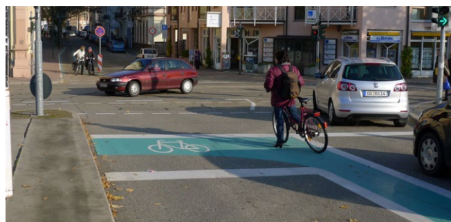
Vorfahrspur und Aufstellfläche zum sicheren Linksabbiegen und Geradeausfahren (Offenburg)

All dies gibt einen guten Überblick über die Effekte sicherer und unsicherer Infrastruktur im Wechselspiel mit dem Verhalten (Regelakzeptanz). Die erhobenen Daten ermöglichen einen genaueren Vergleich der Verkehrssicherheit von verschiedenen Führungsformen, als es bisher möglich war.