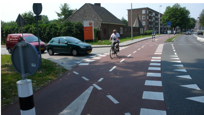
Gesicherte Querung eines links liegenden Zweirichtungsradwegs (Arnheim, Niederlande)

Wesentliche Faktoren sind insgesamt das Verhalten der Verkehrsteilnehmerinnen und Verkehrsteilnehmer, die Infrastruktur und die Fahrzeugtechnik (sowohl beim Fahrrad als auch beim Kraftfahrzeug). Wieweit auch die unterschiedliche Erfahrung von Radfahrern unterschiedlichen Alters eine Rolle spielt, ist noch nicht so genau erforscht.